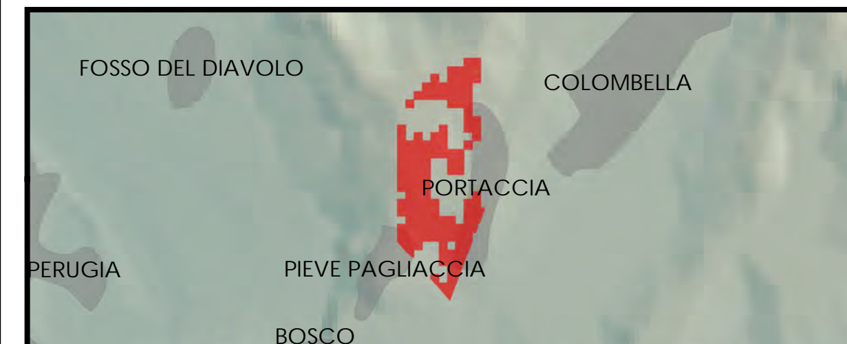
Particolare del cono visuale indagato