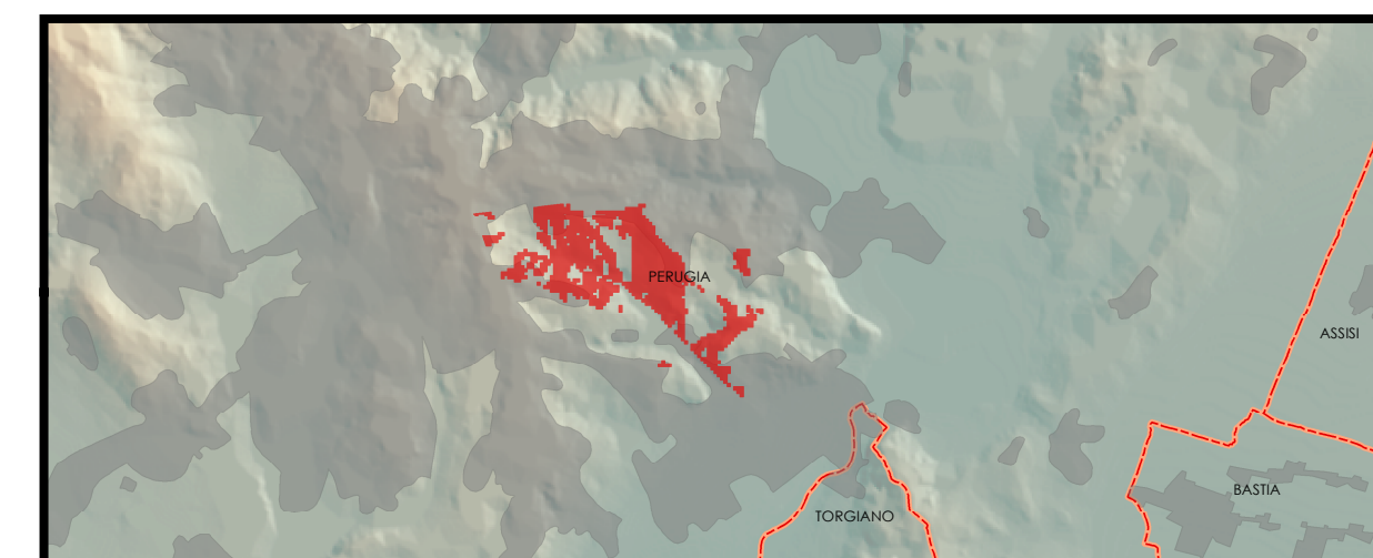
Particolare del cono visuale indagato