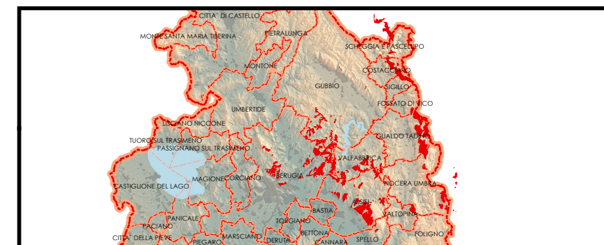
Particolare del cono visuale indagato