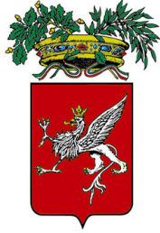
Provincia di Perugia