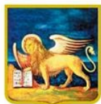
PATROCINIO REGIONE DEL VENETO