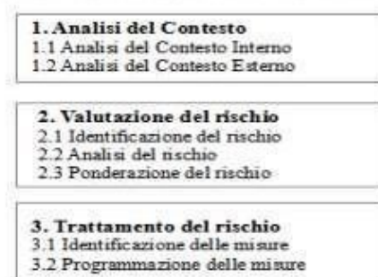
Figura 1 – Il processo di gestione del rischio di corruzione

Volendo schematizzare, il processo di gestione del rischio di corruzione si articola in tre fasi principali; l'analisi del contesto, la valutazione del rischio e il trattamento del rischio , ciascuna delle quali può essere a sua volta scomposta in sottofasi secondo lo schema seguente: